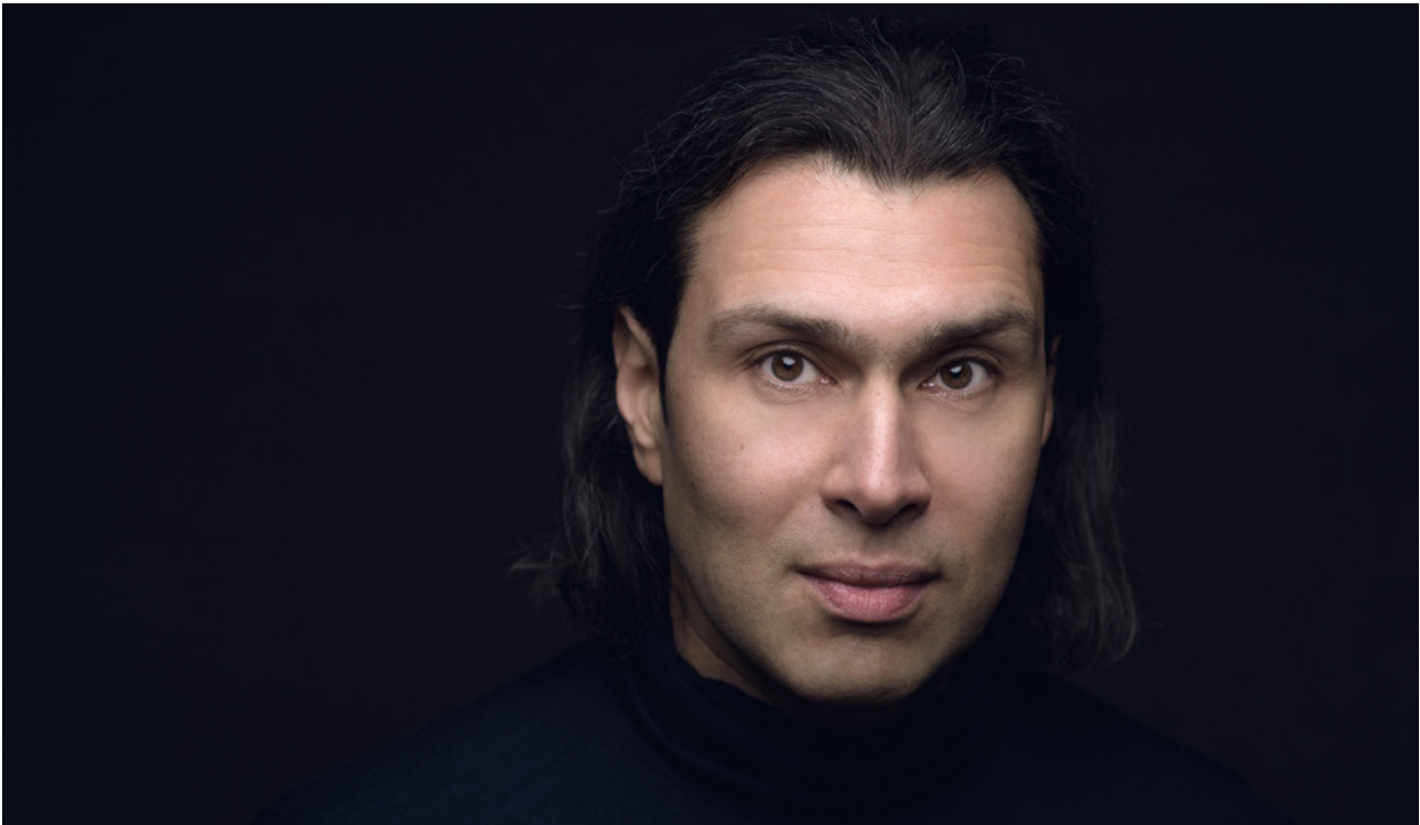
Vladimir Jurowski