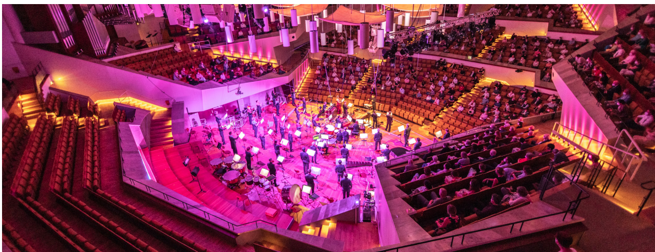
Konzert vom 6. Juni 2021, Philharmonie Berlin