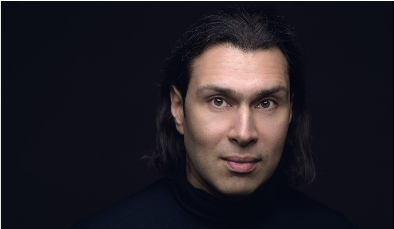
Vladimir Jurowski