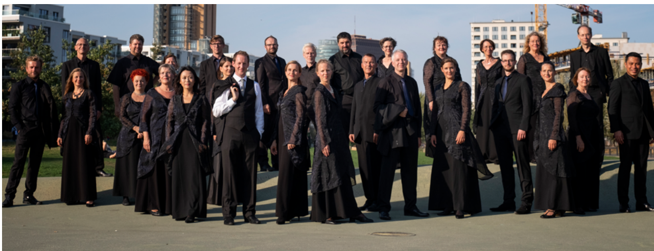
RIAS Kammerchor Berlin