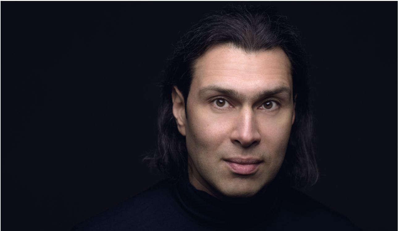
Vladimir Jurowski