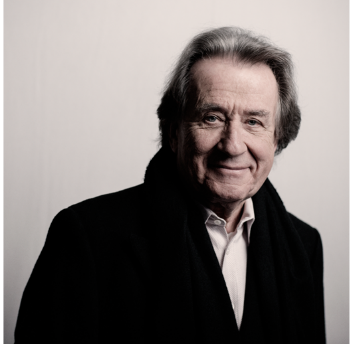
Rudolf Buchbinder

Für die Gesangseinlagen in Igor Strawinskys Ballett „Pulcinella“, welches kokett mit musikalischen Versatzstücken des barocken Italieners Giovanni Battista Pergolesi spielt, hat das RSB die Sopranistin Ina Kancheva, den Tenor Ziad Nehme sowie den Bassisten Tobias O. Hagge zu Gast.