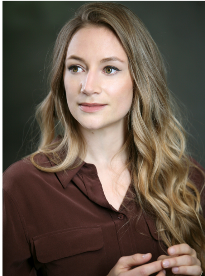
Sabine Devieille

Das letzte Sinfoniekonzert im Rahmen des Strawinsky-Zyklus stellt eine seiner berühmtesten Kompositionen in den Mittelpunkt: „Der Feuervogel“ bezieht seinen Stoff aus der russischen Märchenwelt. Passend zu der „fantastischen“ Programmatik des Konzertes werden das „Märchenpoem“ von Sofia Gubaidulina und Benjamin Britten modern-surrealistische „Les Illuminations“ das Konzert eröffnen. Das RSB begrüßt zudem eine der weltweit führenden Koloratursopranistinnen unserer Zeit: Sabine Devieille.