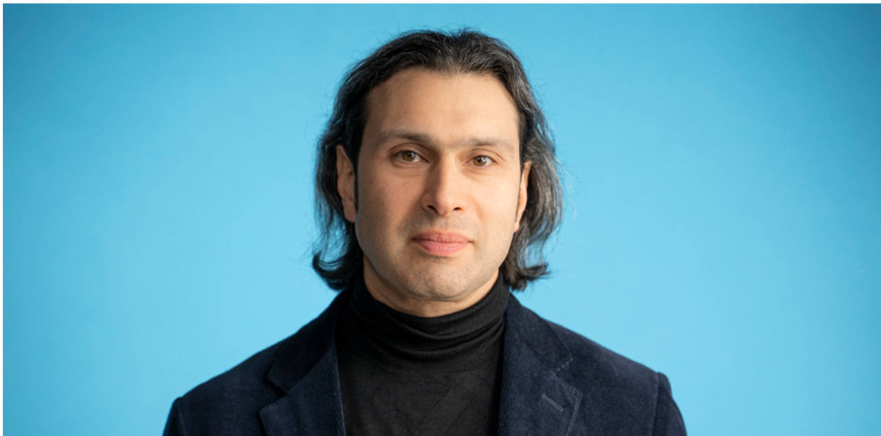
Vladimir Jurowski